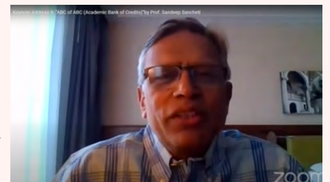
Dept. of Education & Technology

"All sessions were streamed live on Youtube and are available at detsndt.ac.in.