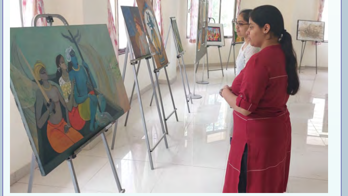
Dept. of Drawing & Painting