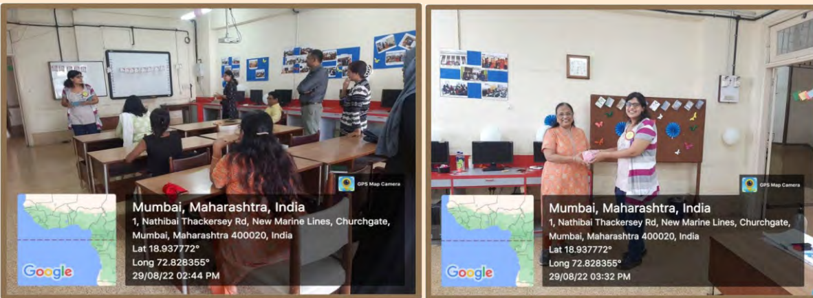
Dept. of SHPT Library Science

The program provided us with the opportunity to have our professors and library staff unwind from their busy schedules and enjoy it for a while. We also discovered a new sense of responsibility as future librarians. The program ended with a group photograph.